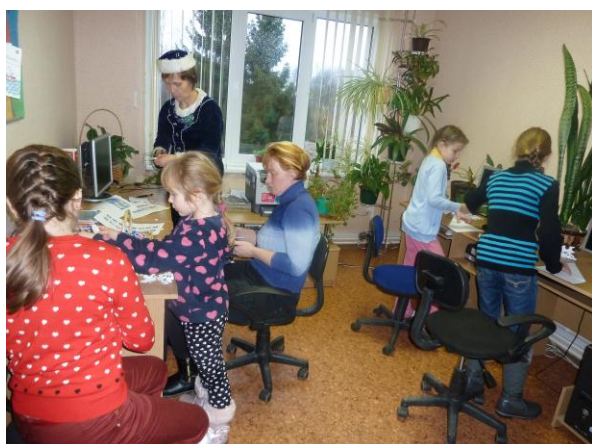
visi kopā strādā