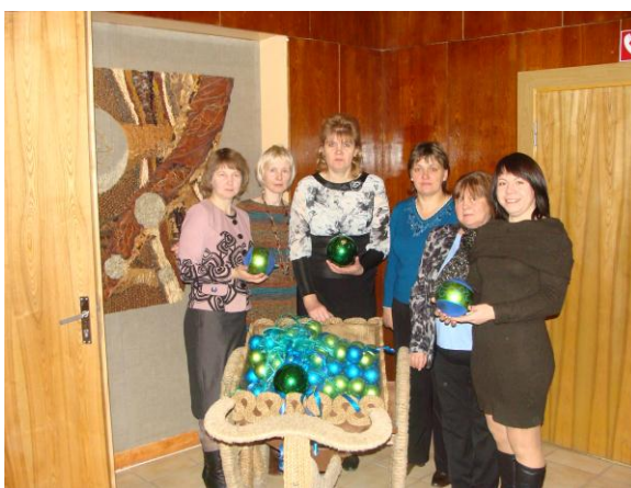
mūsu Ciblas novada bibliotekāres

Laba sadarbība ir visam Ciblas novada bibliotēkām. Mums ir ļoti draudzīgs kolektīvs. Bieži tiekamies lai apspriestu kopīgas problēmas, atrisinātu darba jautājumus un vienkārši lai parunātu.