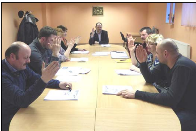
Deputāti vienprātīgi apstiprināja novada 2015. gada budžetu

Komitejās raisītās debātes, tika izdiskutēti svarīgākie jautājumi attiecībā uz budžeta līdzekļu sadalījumu. Arī sēdē neiztika bez diskusijām, jo nāca jauns ierosinājums – lemt par bērnu bezmaksas ēdināšanu novada pirmsskolas izglītības iestādēs. Tomēr budžets tika pieņemts vienbalsīgi.